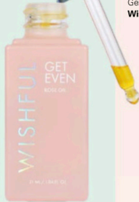
Gezichtsolie Get Even Wishful € 25

We smeren, sprayen en pampere wat af. Wordt je baby blij van, en jij ook.